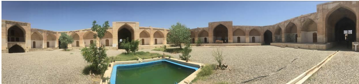
تصویر ۳: فضای داخلی قصر بهرام